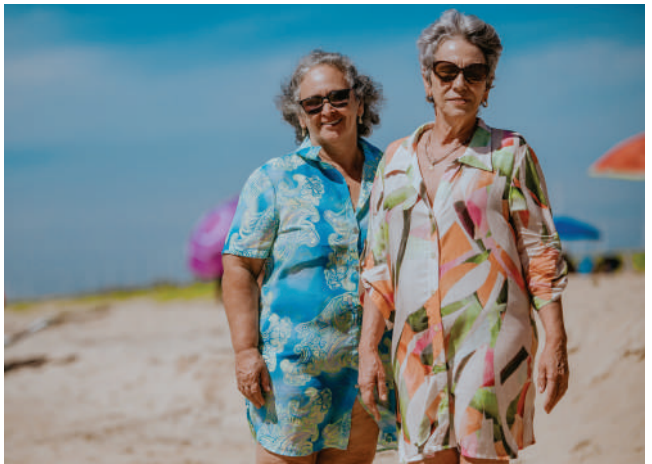
Fotógrafo: Gerson Motta | Praia: Marobá | Editorial: Revista Essence