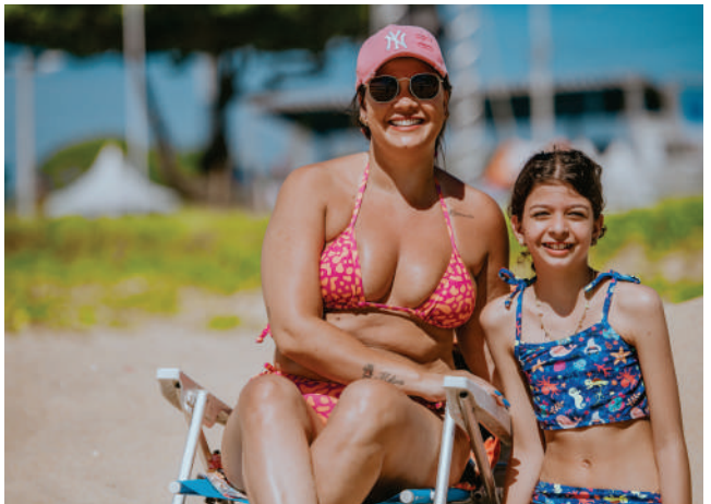
Praia: Marobá | Editorial: Revista Essence